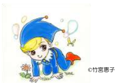
朝倉市子どもの読書活動推進キャラクター