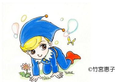
朝倉市子どもの読書活動推進キャラクター