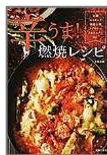
『辛うま! 燃焼レシピ』 上島 亜紀/著