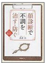
『顔診断で不調を治す。防ぐ』 渡邊 由/著