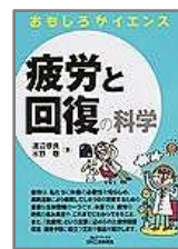
『疲労と回復の科学』 渡辺 恭良/著