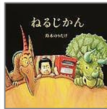
『ねるじかん』 鈴木のりたけ/作・絵