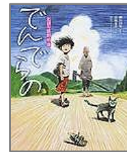
『でんでの』 はた こうしろう/絵 京極 夏彦/文