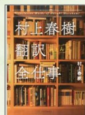
『村上春樹翻訳 <ほとんど>全仕事』 村上 春樹／著