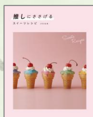
『推しにささげる スイーツレシピ』 メリリル／著