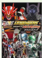
『DOGENGERS NICE BUDDY オフィシャルブック』 ドゲンジャーズ2 製作実行委員会／著