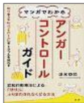
『マンガでわかるアンガーク ントロールガイド』