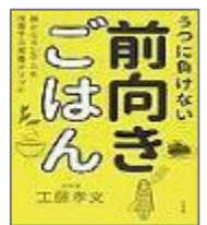
『うつに負けない 前向きごはん』