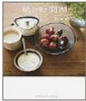
『朝の時間割 おかわり』

春なのに、春だから・・・。 出会い、別れ、春は心も体も大忙し。 3月は自分を見つめなおす大切な月です。