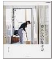
『暮らしのつなぎ方』