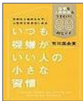
『いつも機嫌がいい人の 小さな習慣』