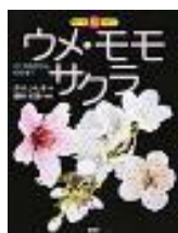
『ウメ・モモ・サクラ』 赤木 かん子／作