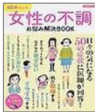
『40歳からの女性の不調 お悩み解決 BOOK』