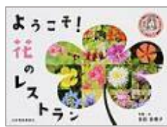
『ようこそ！花のレストラン』 多田 多恵子／写真・文