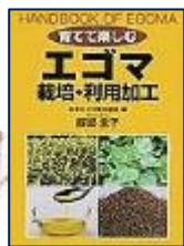
『育てて楽しむエゴマ栽培・利用加工』服部圭子(著) 創森社