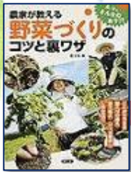
『農家が教える野菜づくりのコツと裏ワザ』農文協(編) 農山漁村文化協会