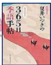
『夏井いつきの365日季語手帳』夏井いつき(著) レゾンクリエイト

新年を迎え、心も新たに何か「め」を育てて楽しみませんか？ 2019年もみなさまにとって素敵な一年になりますように。