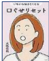
『いちいち悩まなくなる口ぐせリセット』大嶋信頼(著) 大和書房