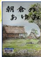
『朝倉のあゆみ』 『朝倉のあゆみ』編集委員会(発行)