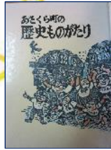
『あさくら町の歴史ものがたり』 朝倉町教育委員会