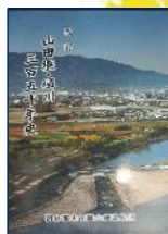
『山田堰・堀川三百五十年史』 朝倉郡山田堰土地改良区