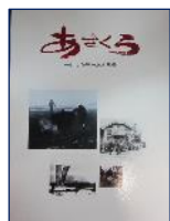
『あさくら』 朝倉町役場(発行)