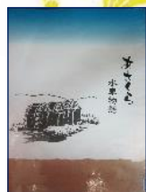
『あさくら水車物語』 朝倉町役場(発行)